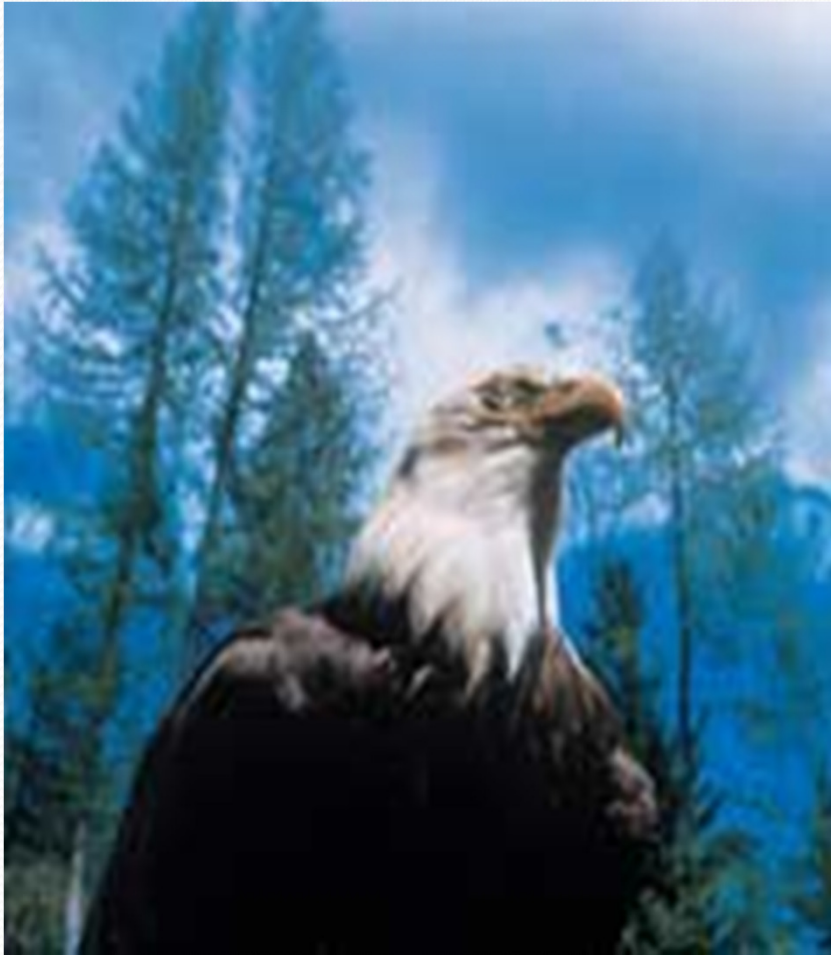
VISÃO DE ÁGUIA