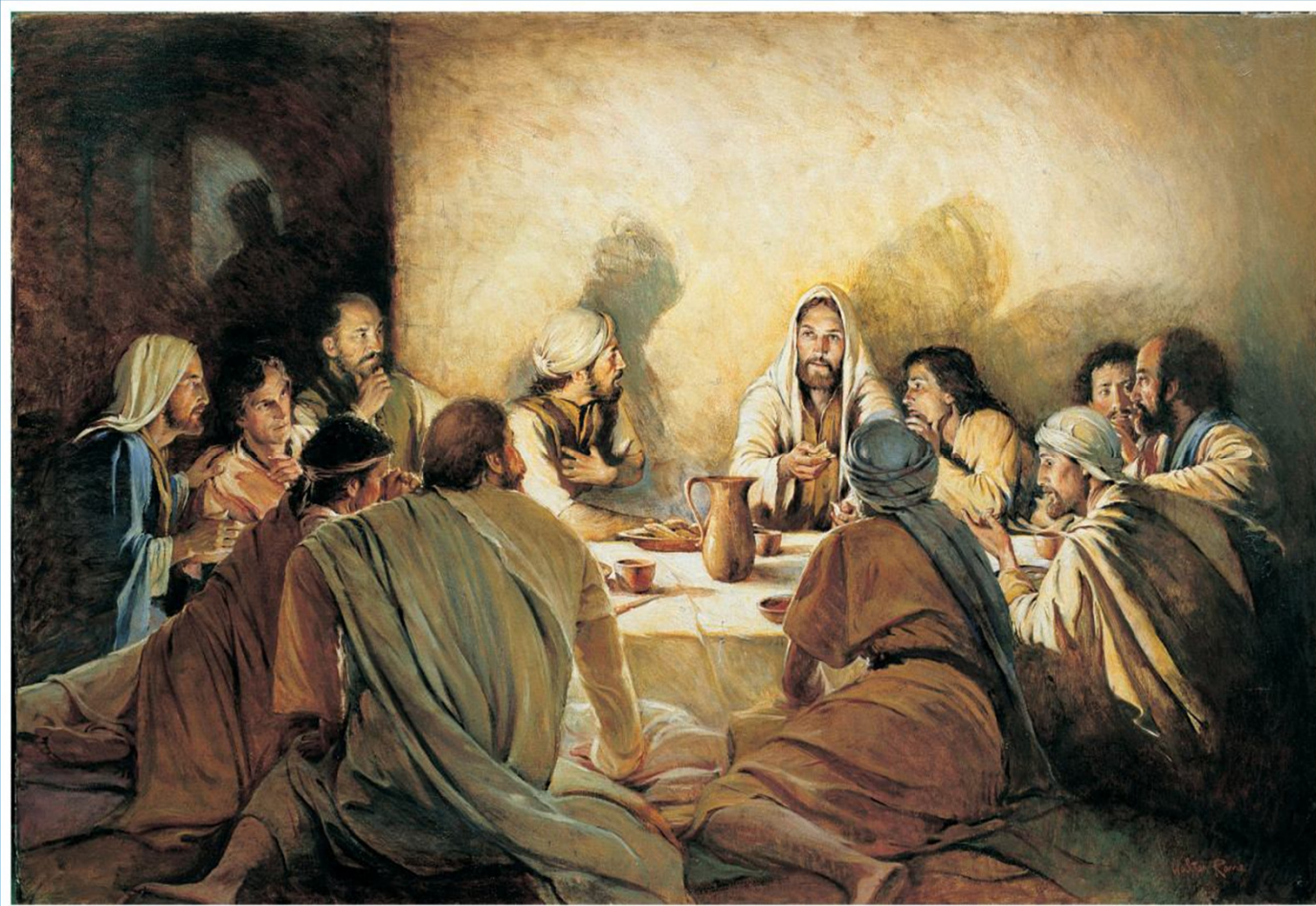
In Remembrance of Me, by Walter Rane